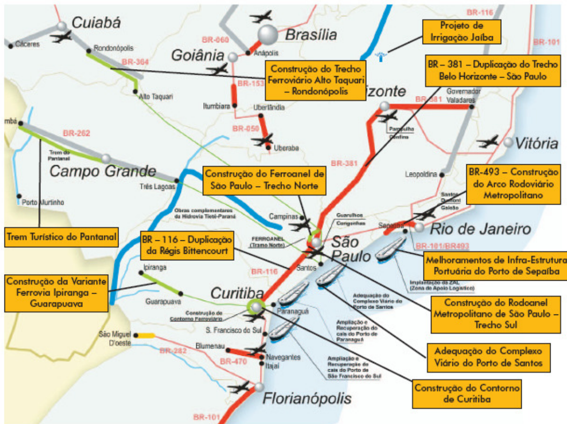
Figura 3 – Projetos Federais para PPP nas regiões Sudeste, Sul e Centro-Oeste