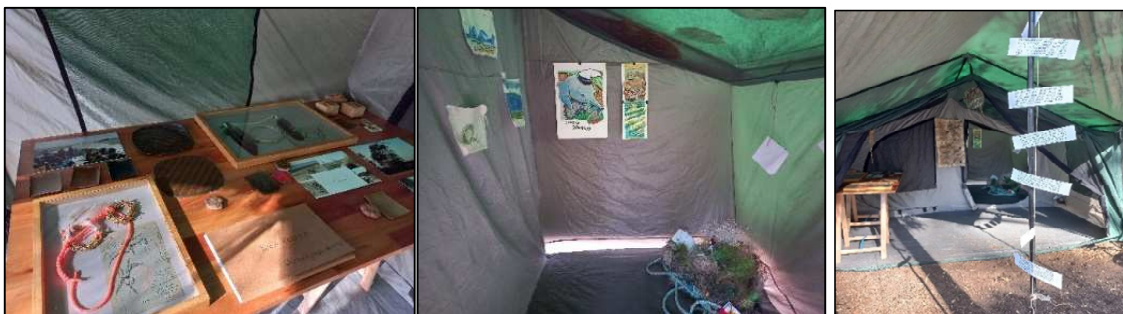
Figura 6. Muestra de la residencia a Isla Bermejo, en la Fiesta de los Humedales de Villa del Mar

A partir de esta experiencia en las islas, se llevan a cabo exposiciones, se edita el material de difusión y se participa en distintos espacios de sociabilización (artísticos, educativos, académicos, eventos) (figura 6). De esta manera, se logra difundir no solo el trabajo realizado por los participantes de las residencias sino también dar a conocer lo que existe más allá del puerto local.