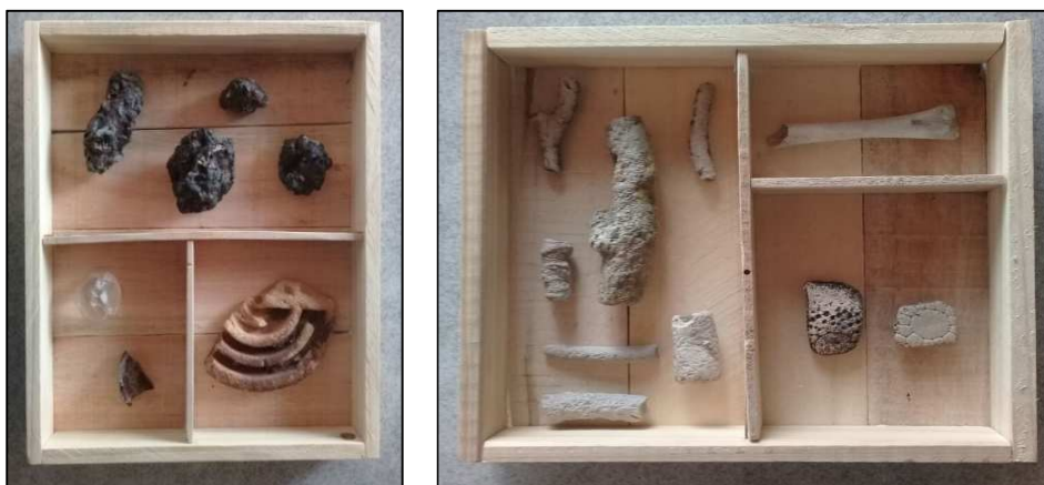
Figura 7. Cajas pedagógicas con los objetos y fragmento de caparazón de gliptodonte encontrados

En el caso de Massi, tuvo dos ideas: por un lado, buscar en el suelo de la isla el impacto de las personas en el lugar a través de las huellas, para eso juntó dos porciones de la isla con las pisadas. Por otro lado, se relaciona con parte de su trabajo que es recolectar objetos (fragmentos de vidrios, parte de piezas industriales, minerales, etc). El artista trajo materiales, principalmente industriales, para analizar la convivencia del hombre en la costa, con el fin de ver como impactaba en ese ecosistema. En ese trabajo de juntar piedras, se encuentra con fragmentos de gliptodonte, por lo que hizo dos cajas como módulos didácticos (figura 7) para que sean utilizados como material pedagógico en la visita de alumnos tanto en el Museo como en la oficina de Guardaparques de la Reserva. Uno de los módulos tiene que ver con la relación del hombre, el polo petroquímico y el impacto en ese lugar. El otro módulo, se vincula con lo más agreste, con lo natural. Resulta ser que esas piezas de gliptodonte tienen que ver con el dragado que se hizo en el Canal Principal para el acceso de grandes barcos (año 2013), es así que se reactiva el tema de la agresión e impacto del hombre en ese lugar.