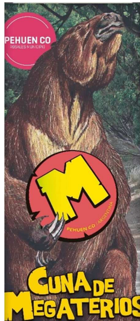
Figura 3: Marca de producto paleontológico Pehuen Có