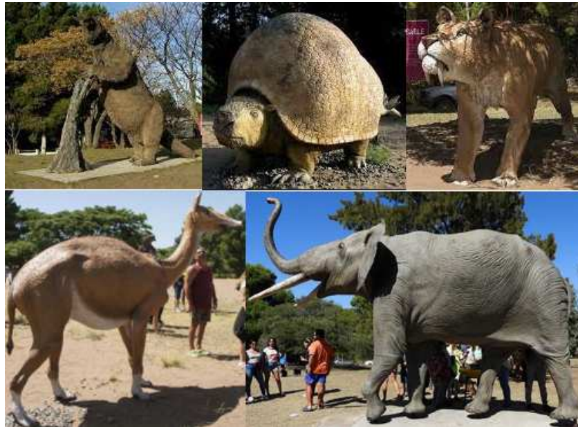
Figura 4. Réplicas de animales extintos ubicados en el parque temático

Con el correr de los años se han ido incorporando más réplicas de animales extintos tales como, Gliptodonte (2018) que también estuvo financiado en un 100% por los comerciantes pehuenquinos, Tigre dientes de sable (2019), Macrauchenia (2019) y Notiomastodonte (2020) quienes forman parte de una segunda etapa del proyecto (Figura 4) y cuya financiación también contó con aportes del Fondo Nacional de Ciencia y Tecnología (FONCyT) gestionados por Fundación del sur para el desarrollo tecnológico (FUNDASUR), del Municipio de Coronel Rosales y de la Cámara de Diputados de la Provincia de Buenos Aires.