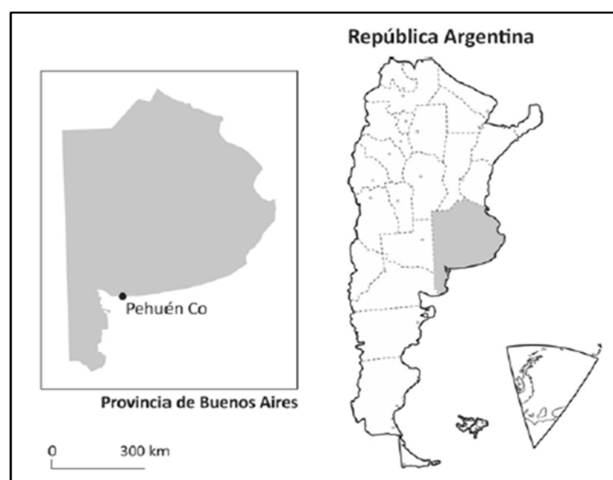
Figura 1: Localización de la localidad de Pehuen Có

Pehuen Có es un balneario localizado en el sudoeste de la provincia de Buenos Aires (Argentina), sobre la costa atlántica. Pertenece al partido de Coronel de Marina Leonardo Rosales, situándose a 68 km de Punta Alta (ciudad cabecera del partido) y a 85 km de Bahía Blanca. El ingreso a la villa se realiza por la Ruta Provincial N°113/2, la cual conecta con la Ruta Nacional N°3 (Figura 1).