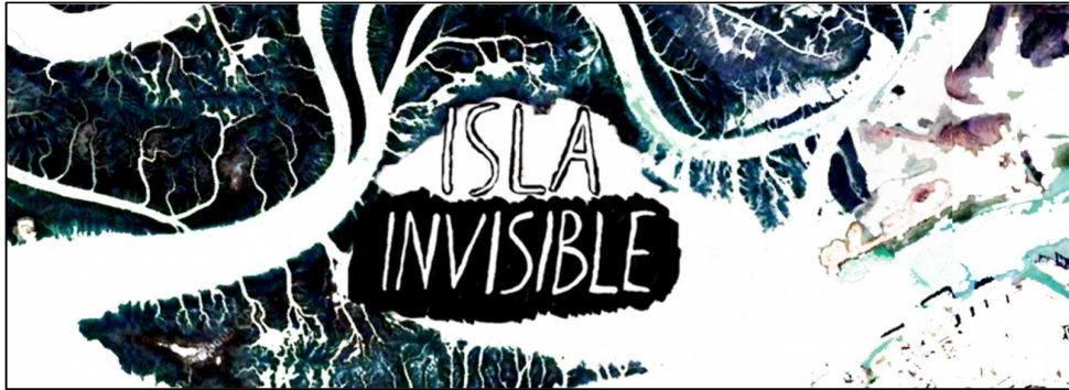
Figura 5. Logo del proyecto Isla Invisible